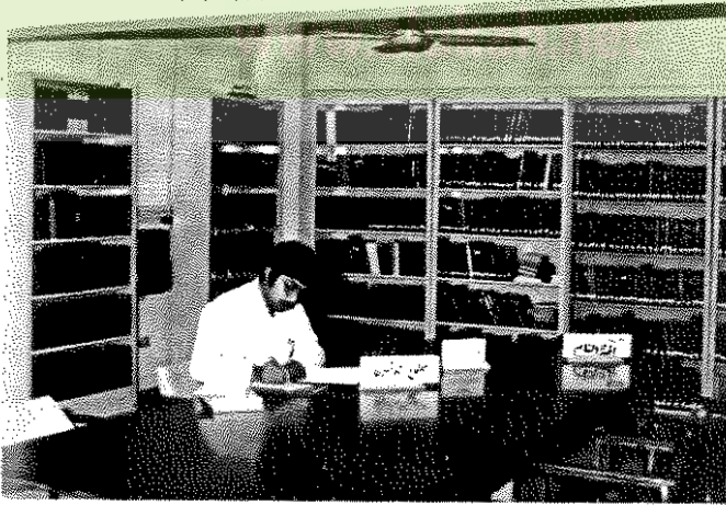
● جانب من مكتبة المركز وقاعة المطالعة ●