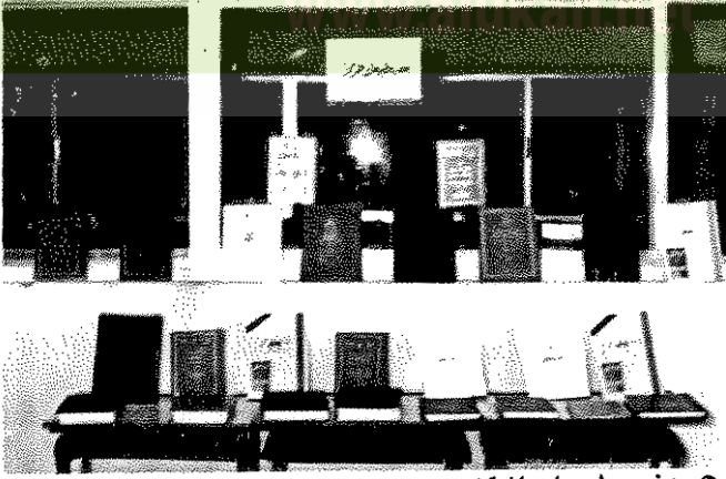
● بعض مطبوعات المركز ●