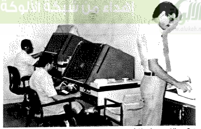
● قسم التصوير في المركز ●