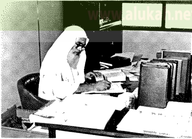
● أحد الباحثين في المركز