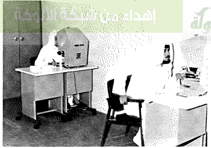
● القارئ وطريقة المطالعة