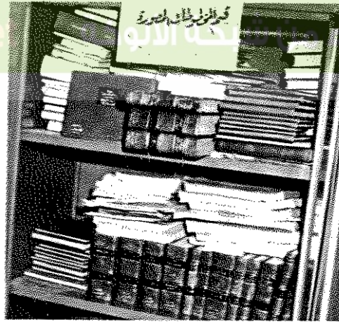
● قسم المخطوطات المصورة بالمركز ●